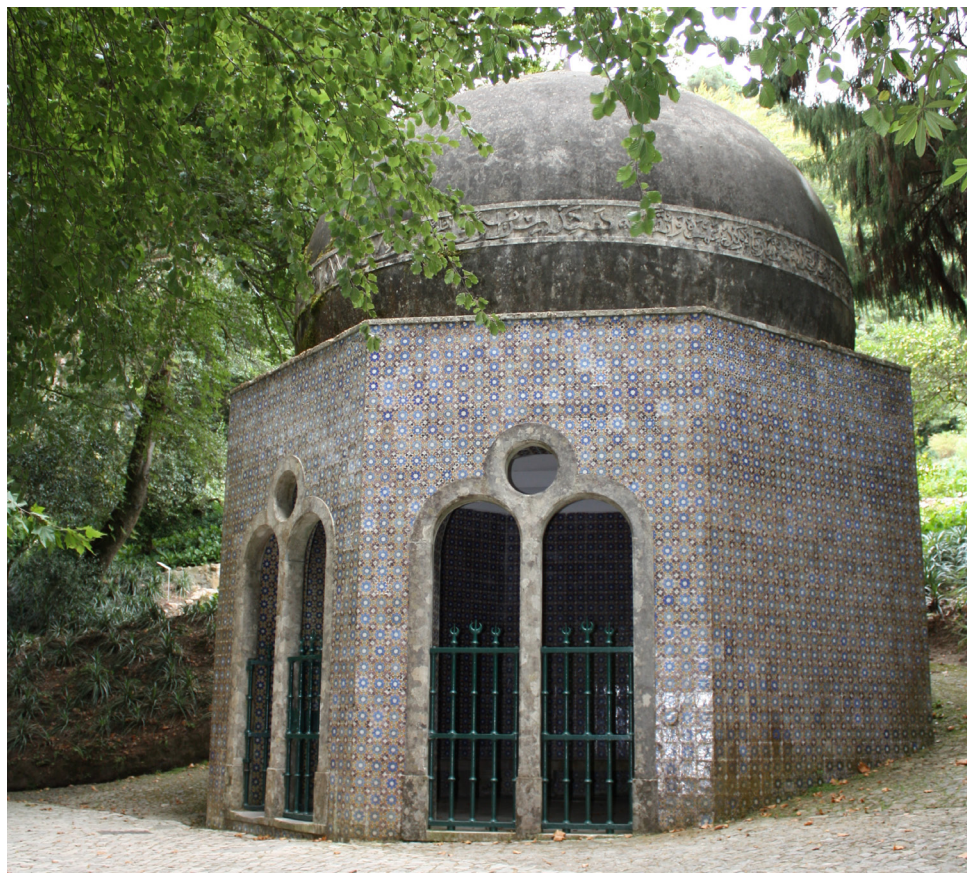
Exterior da Fonte dos Passarinhos.